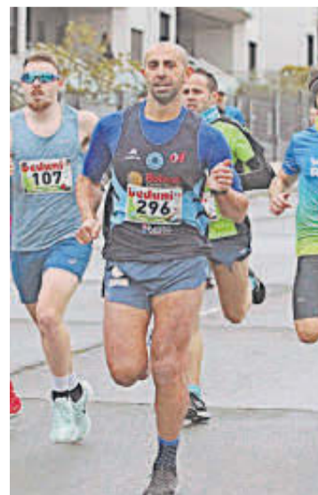
Carrera del año pasado.

Los interesados en participar en la V Carrera San Silvestre Solidaria pueden inscribirse de manera virtual, a través de la página web de la Universidad Pontificia upsa.es , y también de forma presencial en el Servicio de Deportes de la UPSA (Edificio Multiusos del Campus Champagnat).